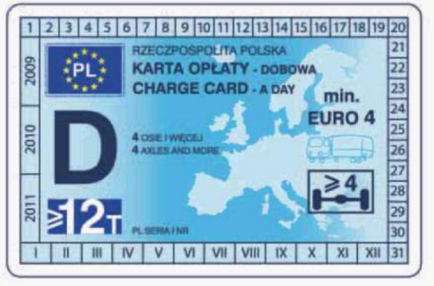
winieta — awers