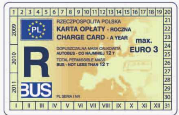
winieta — awers