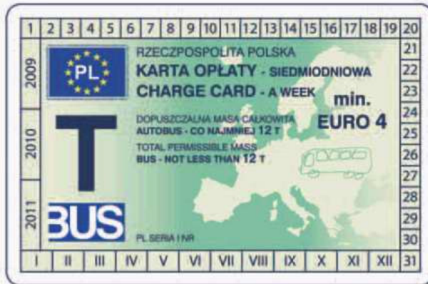
winieta — awers