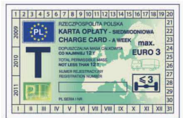
odcinek kontrolny — awers