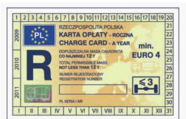
odcinek kontrolny — awers