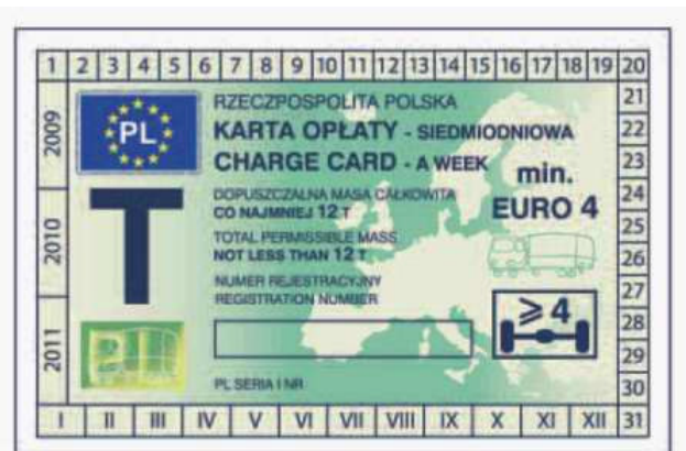
odcinek kontrolny — awers