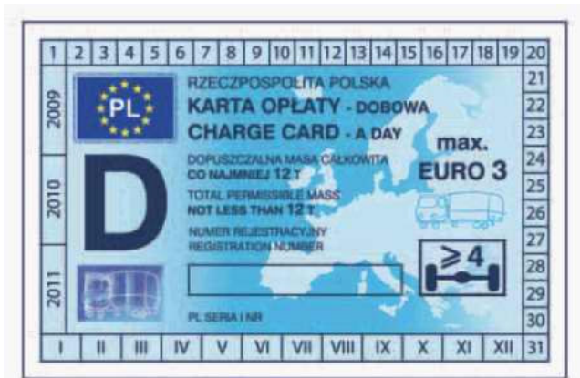
odcinek kontrolny — awers