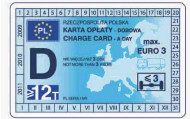
winieta — awers