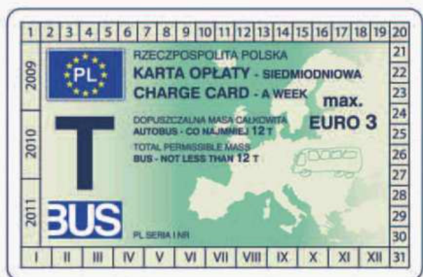
winieta — awers