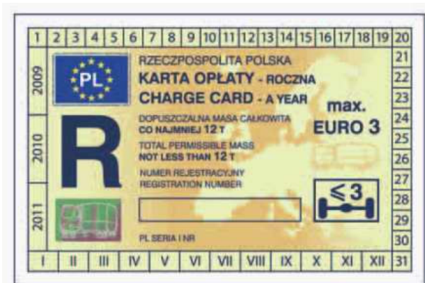
odcinek kontrolny — awers