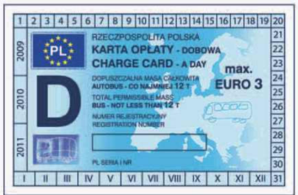
odcinek kontrolny — awers