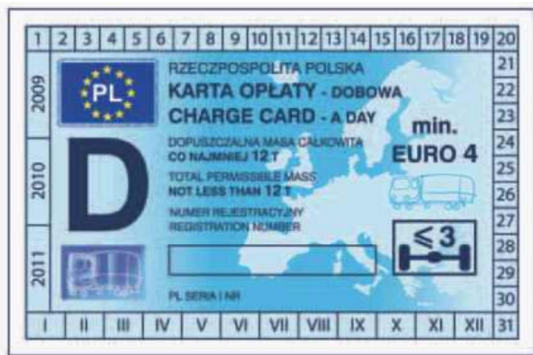
odcinek kontrolny — awers