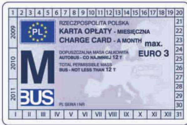
winieta — awers