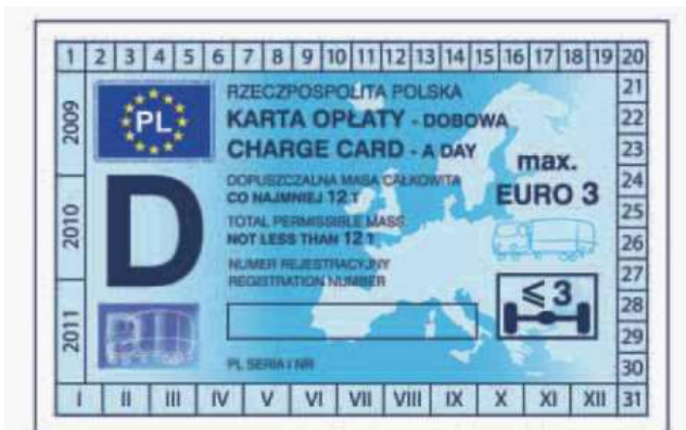
odcinek kontrolny — awers

WZÓR KARTY OPŁATY DOBOWEJ DLA POJAZDÓW (ZESPOŁÓW POJAZDÓW) INNYCH NIŻ AUTOBUSY O DOPUSZCZALNEJ MASIE CAŁKOWITEJ CO NAJMNIEJ 12 TON I LICZBIE OSI MAX. 3 SPEŁNIAJĄCYCH WYMAGANIA NORMY MAX. EURO 3