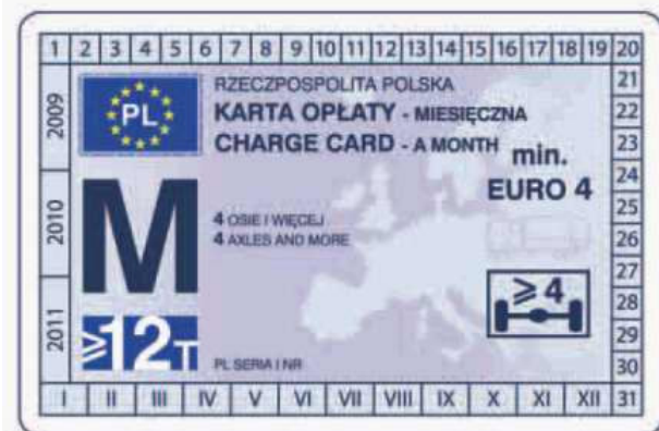
winieta — awers