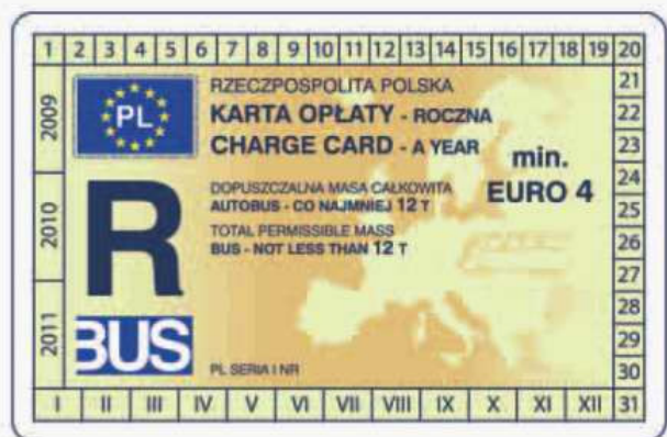
winieta — awers