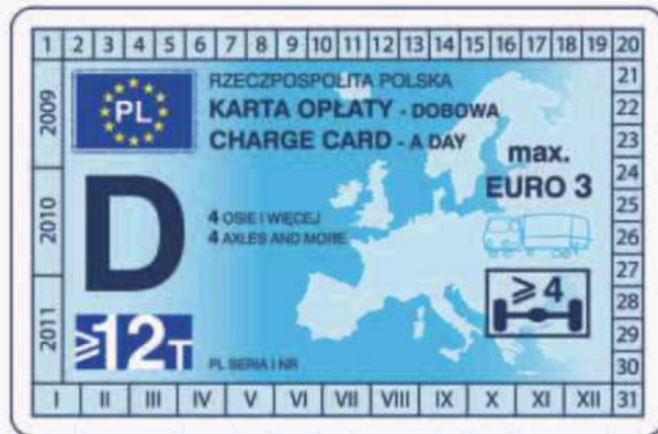
winieta — awers