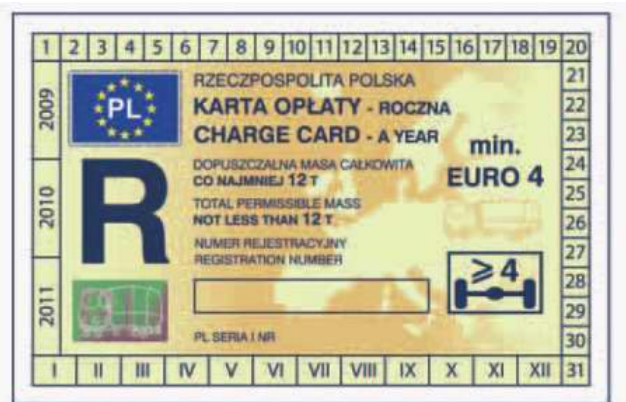
odcinek kontrolny — awers