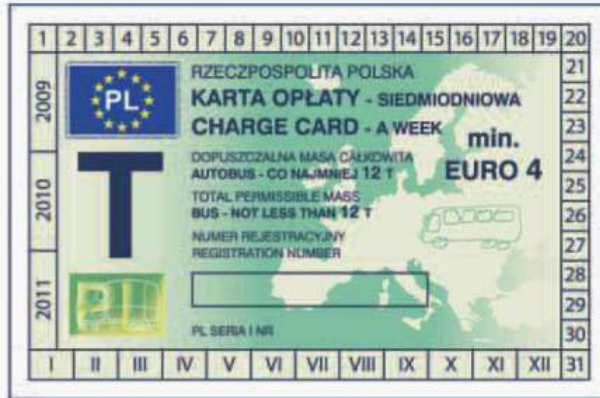
odcinek kontrolny — awers