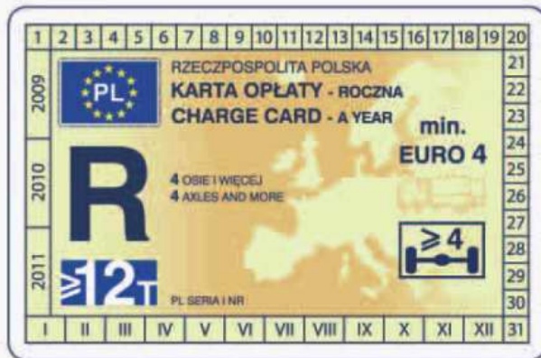
winieta — awers