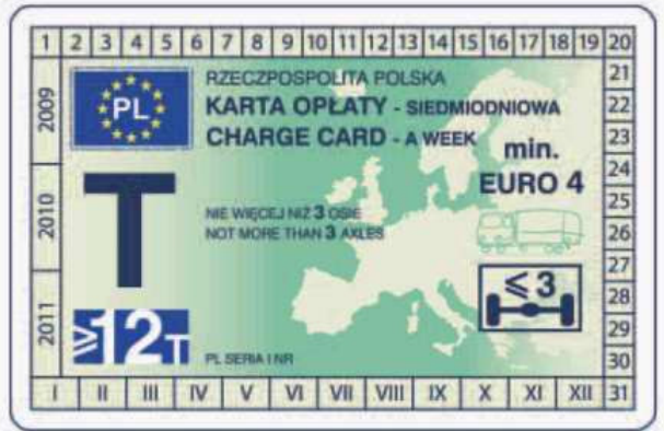
winieta — awers