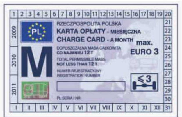
odcinek kontrolny — awers