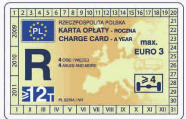
winieta — awers