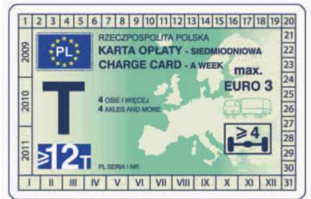
winieta — awers