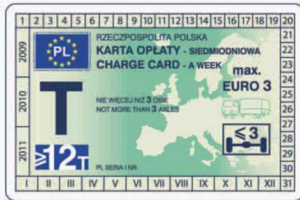
winieta — awers