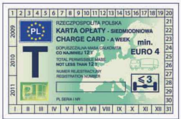
odcinek kontrolny — awers