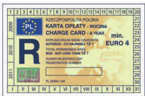
odcinek kontrolny — awers