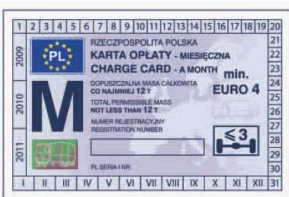
odcinek kontrolny — awers