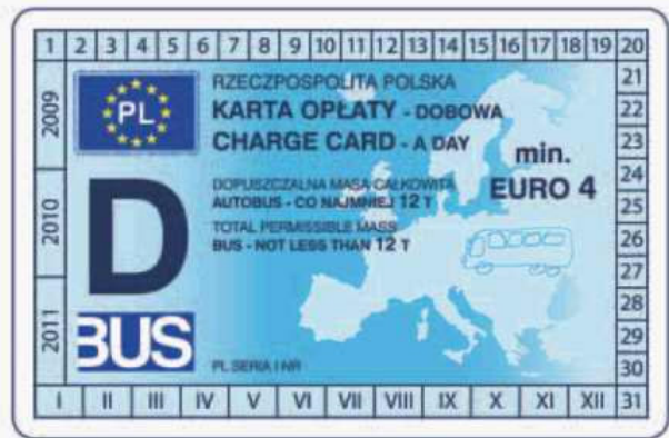
winieta — awers