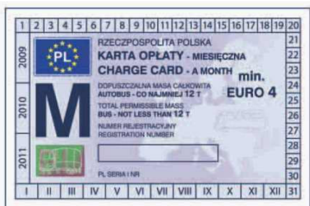
odcinek kontrolny — awers