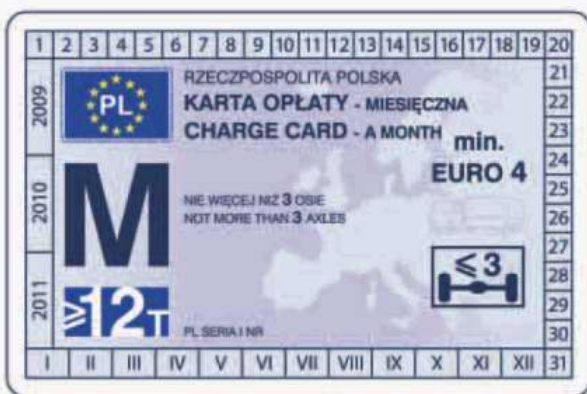
winieta — awers