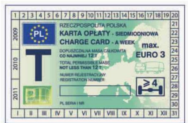
odcinek kontrolny — awers