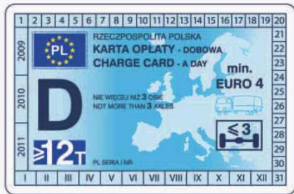
winieta — awers