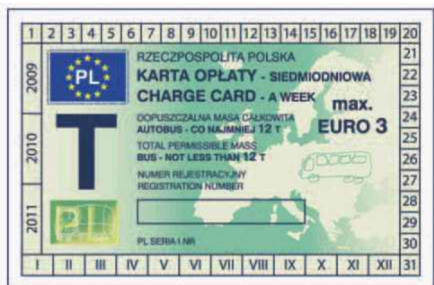
odcinek kontrolny — awers