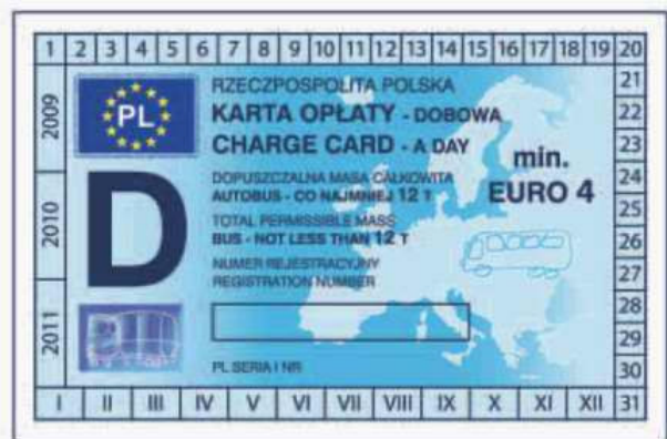
odcinek kontrolny — awers