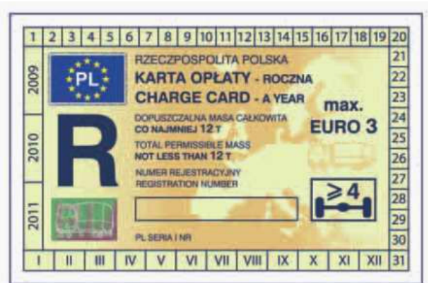
odcinek kontrolny — awers