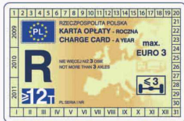
winieta — awers