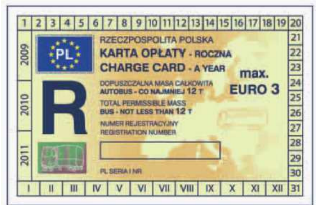
odcinek kontrolny — awers