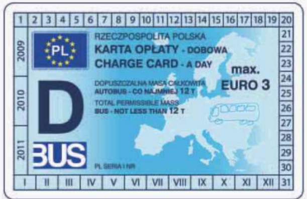
winieta — awers